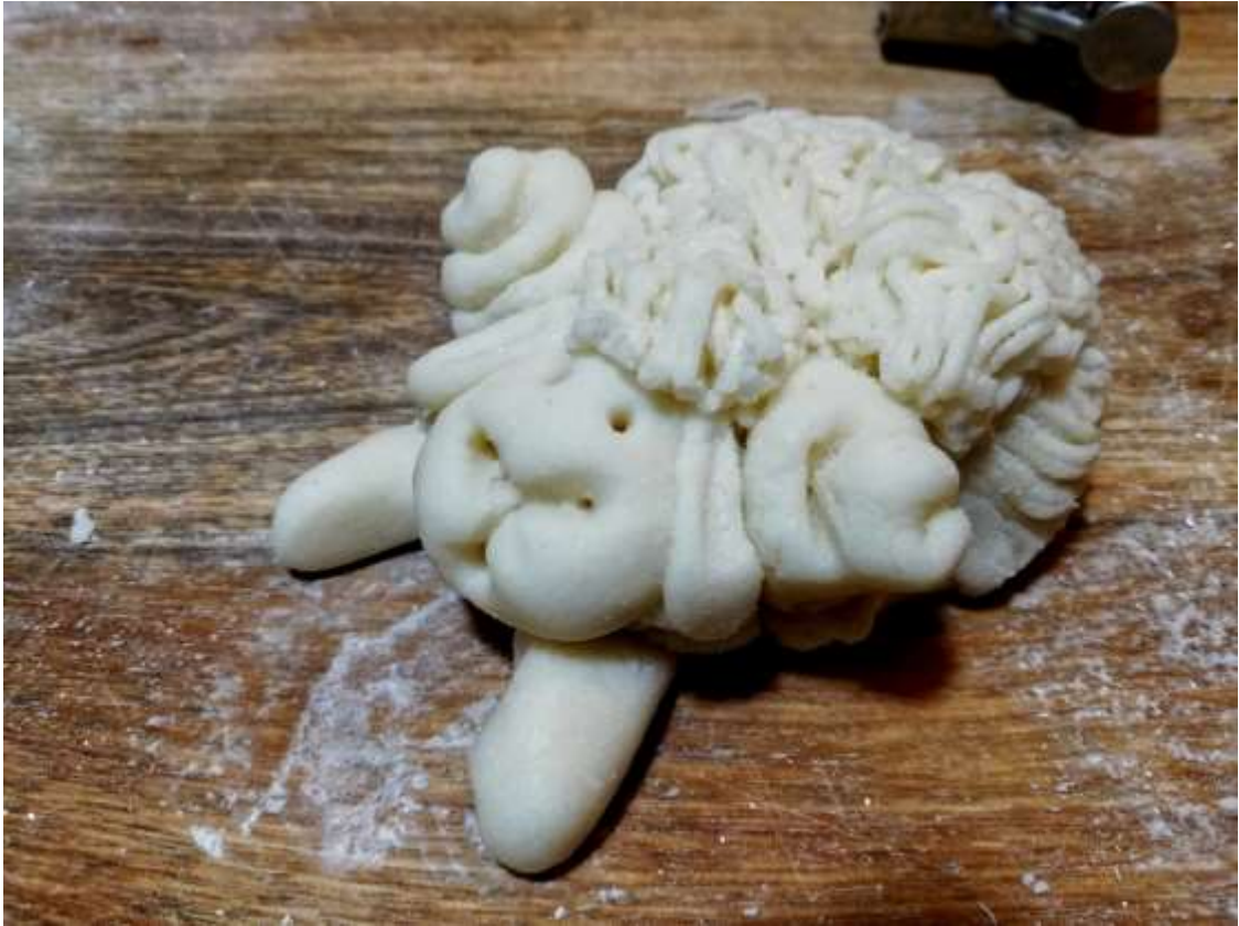
I tylne nogi.